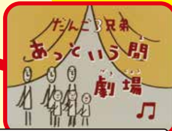
だんご3兄弟あつという間劇場(アニメ)